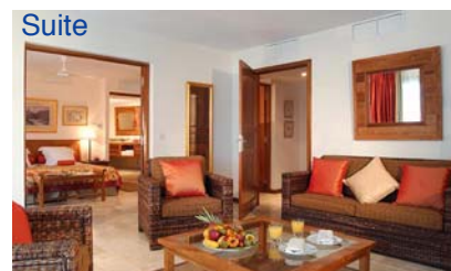
Luxe Rez de Piscine